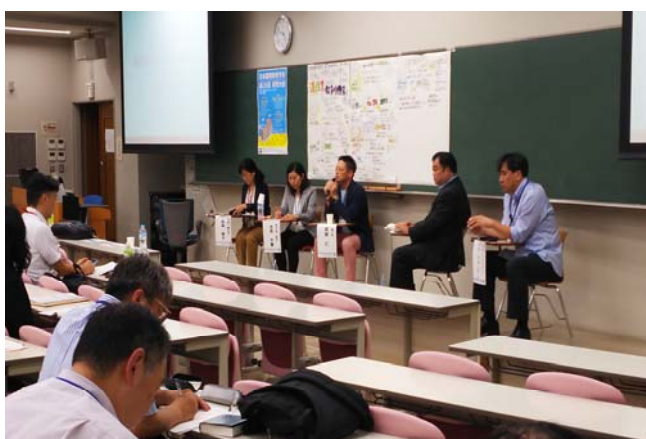
第29回大会 公開シンポジウム