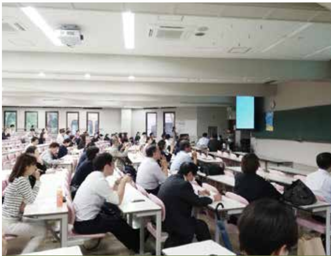
第29回研究大会(一橋大学)公開シンポジウムの様子

本学会は2020年に創立30周年を迎えます。これを記念して30周年記念大会の開催や30周年記念論集の刊行、海外における国際シンポジウムへの協力などが企画されています。